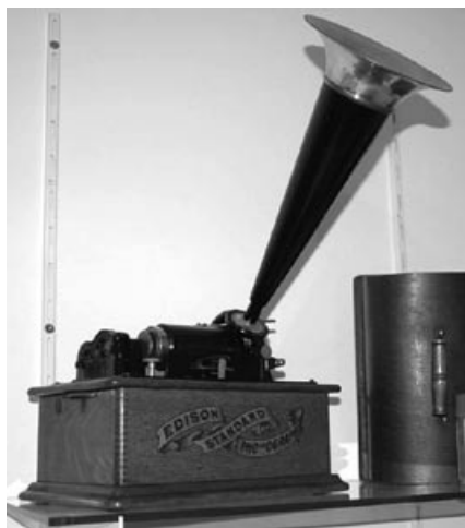
Der Edison-Phonograph – der Urahn des CD-Players.

Rohrer lässt auch Musikdosen mit Glocken und Lamellenzungen, einen funktionstüchtigen Edison-Phonographen und schliesslich die Grammophone mit ihren blechernen Trichter-Lautsprechern erklingen und lässt uns über einen musikalischer Stumpenspender lachen, der wie andere Miniaturen aus den Werkstätten von Sainte-Croix stammt.